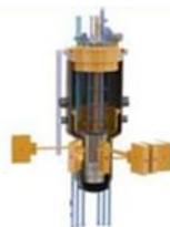
МБИР Ведется сооружение

Энергетические реакторы (БН – быстрый натриевый)