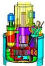
CFR-600 Ведется сооружение

Надежность и безопасность конструкции реактора БН интегрального типа подтверждены успешной эксплуатацией реактора БН-600 в течение 41 года с высоким КИУМ (около 0.8) и минимальным радиационным воздействием на окружающую среду.