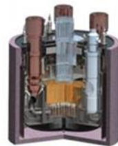
БН-1200 В стадии разработки